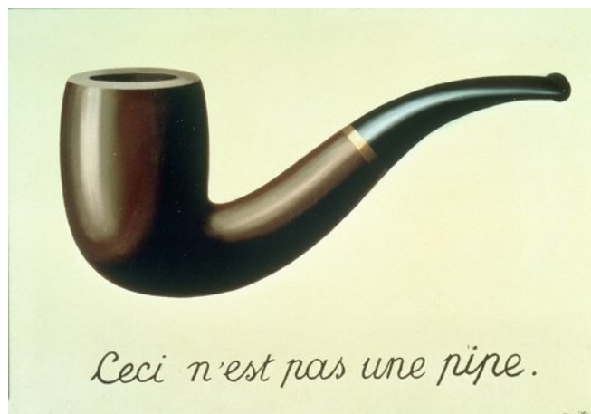
Magritte, La trahison des images, 1928 - Musée d'art du comté de Los Angeles

Dans le spectacle, essaie de relever des moments où tu vois des choses qu'on ne peut pas voir. Comment appelle-t-on ce genre de spectacle ?