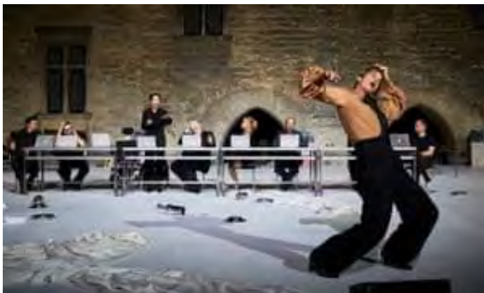
Extraordinary talent but ultimately vacuous ... Pascal Rambert's Architecture .

Andrew Todd - Mon 8 Jul 2019 20.00 BST Last modified on Wed 10 Jul 2019 14.13 BST