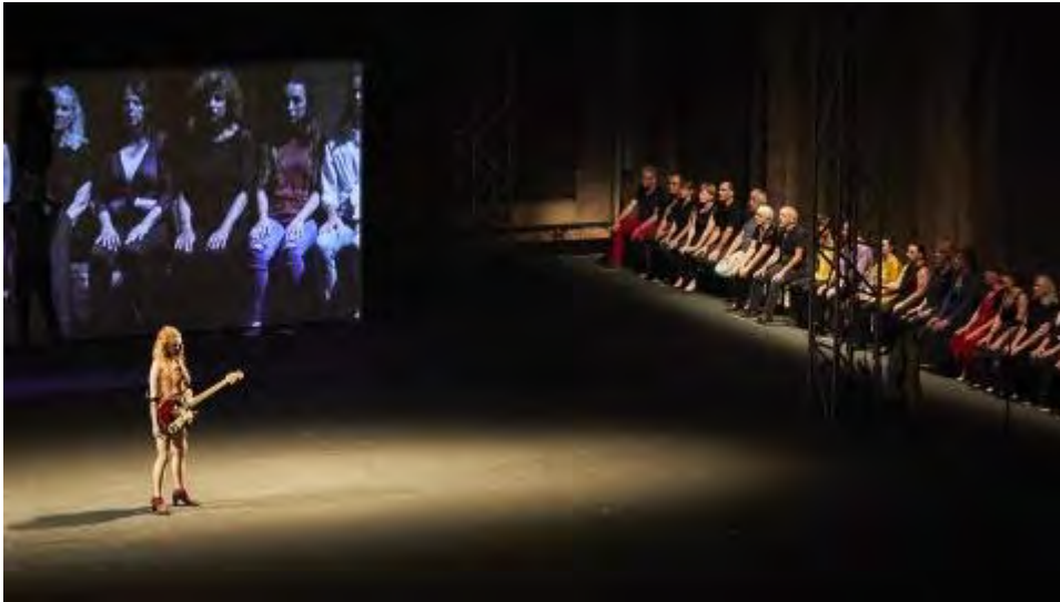
"Nous, l'Europe, banquet des peuples" de Laurent Gaudé

Dimanche soir, l'invité était cette fois Susan George, l'écrivaine franco-américaine et fondatrice d'ATTAC (Association pour la taxation des transactions financières et pour l'action citoyenne). La militante alter-mondialiste a vanté l'Europe et la France, " pays béni des Dieux ", où l'éducation et les soins médicaux sont gratuits. " Croire en l'Europe c'est croire que les hommes peuvent changer les choses " juge-t-elle. Puis, s'adressant au public : " qui est notre commissaire européen ? " Une seule petite voix dans l'immense cour à ciel ouvert du lycée Saint Joseph cite Pierre Moscovici. " On ne peut pas dire que l'on parle beaucoup de lui ! " glisse dans un sourire la vieille dame toujours alerte.