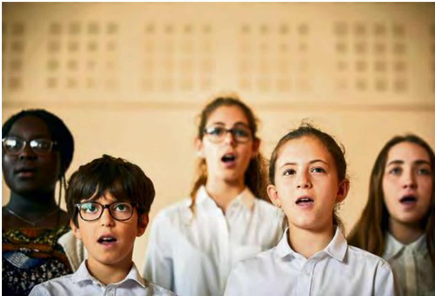
Le chœur d'amateurs de « Nous, l'Europe, banquet des peuples ».

Ce qui n'empêche pas le spectacle d'exister visuellement avec tout autant de puissance. Et pour dire cette Europe trop technocratique, qui peine à se vivre comme un peuple, c'est d'abord ce peuple, en concentré, en miniature, que les deux hommes convoquent sur le plateau, sous les étoiles du ciel d'Avignon : un ensemble de comédiens, performeurs, chanteurs et