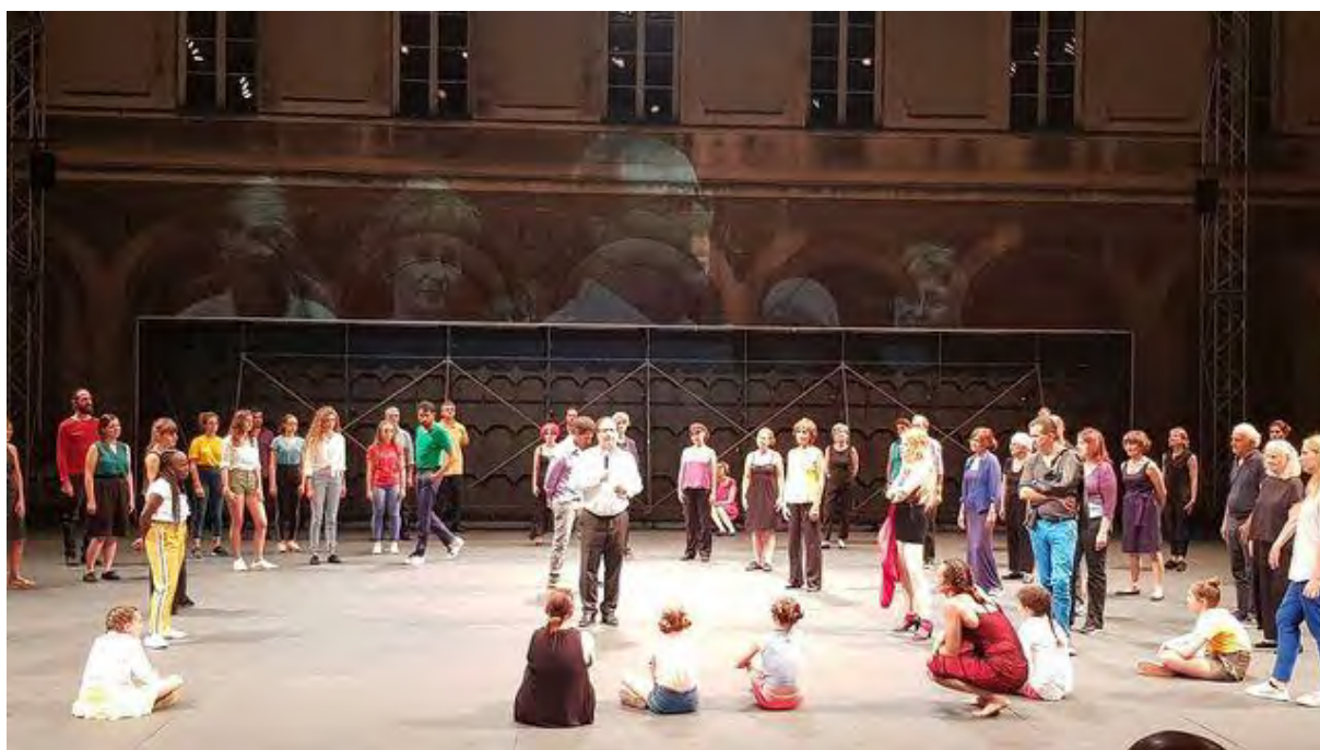
François Hollande sur scène au Festival d'Avignon dans Nous l'Europe

C'était hier soir au 73e Festival d'Avignon. L'ancien Président de la République est monté sur scène au milieu de la troupe de "Nous l'Europe, banquet des peuples", la pièce de Roland Auzet sur un texte de Laurent Gaudé.