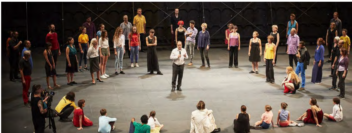
François Hollande, invité-témoin sur la scène du spectacle "Nous, l'Europe, banquet des peuples", samedi 6 juillet 2019

Avec "Nous, l'Europe, banquet des peuples", l'écrivain Laurent Gaudé secoue le public d'Avignon en pleine fournaise et réussit à redonner du souffle et de la sève à l'Union européenne.